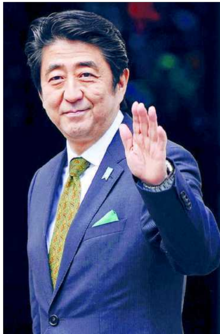
Shinzo Abe, arrivé au pouvoir le 26 décembre dernier, mène une politique à contre-courant.